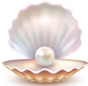
Ilustração de alta complexidade: